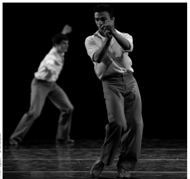
«The Fugue»

Elle a chorégraphié pour de nombreuses institutions comme le Ballet de l'Opéra de Paris, le Royal Ballet, NYC Ballet... Depuis 1963, Twyla Tharp a chorégraphié plus de 135 ballets, 5 films pour les studios de Hollywood ( don't Hair, Ragtime, Amadeus... ), a dirigé et mis en scène des spectacles à Broadway ( When We Were Young, The Catherine Wheel, Singin' In The Rain... ). Aujourd'hui Twyla Tharp continue d'écrire, de créer et de donner des conférences partout dans le monde.