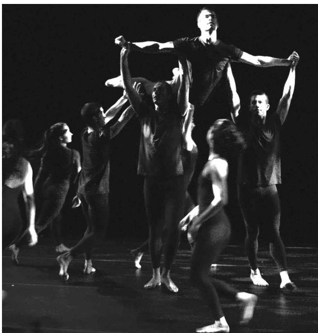
«North Star»