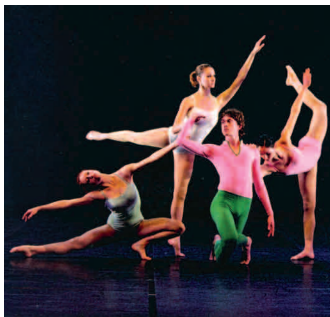
«Septet» de Merce Cunningham

Deux frères. Un soir plein de promesses.