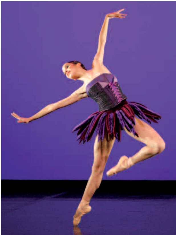
«Favoritias» de José Martinez