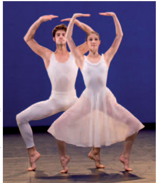
«Aureole» de Paul Taylor

Danseur virtuose et éclectique, Paul Taylor fut l'interprète de chorégraphes aussi divers que Doris Humphrey, Merce Cunningham ou Martha Graham entre 1952 et 1962. Dès 1954, il commence à chorégrapier. Ses premières œuvres, formalistes et abstraites, empruntent les méthodes des avant-gardes post-modernes. C'est avec Aureole , petite merveille de danse pure, qu'il connaît son premier triomphe ; la compagnie entreprend dès lors de nombreuses tournées dans le monde entier. Au-delà de la diversité de son œuvre apparaît une sorte d'alternance entre des pièces «lumineuses», selon ses propres termes, et d'autres plus sombres ; certaines radicalement abstraites et d'autres explicitement narratives. Le succès populaire de Paul Taylor tient sans doute à la vitalité, la musicalité et l'humour de ses pièces, qui n'excluent pas une grande complexité d'écriture.